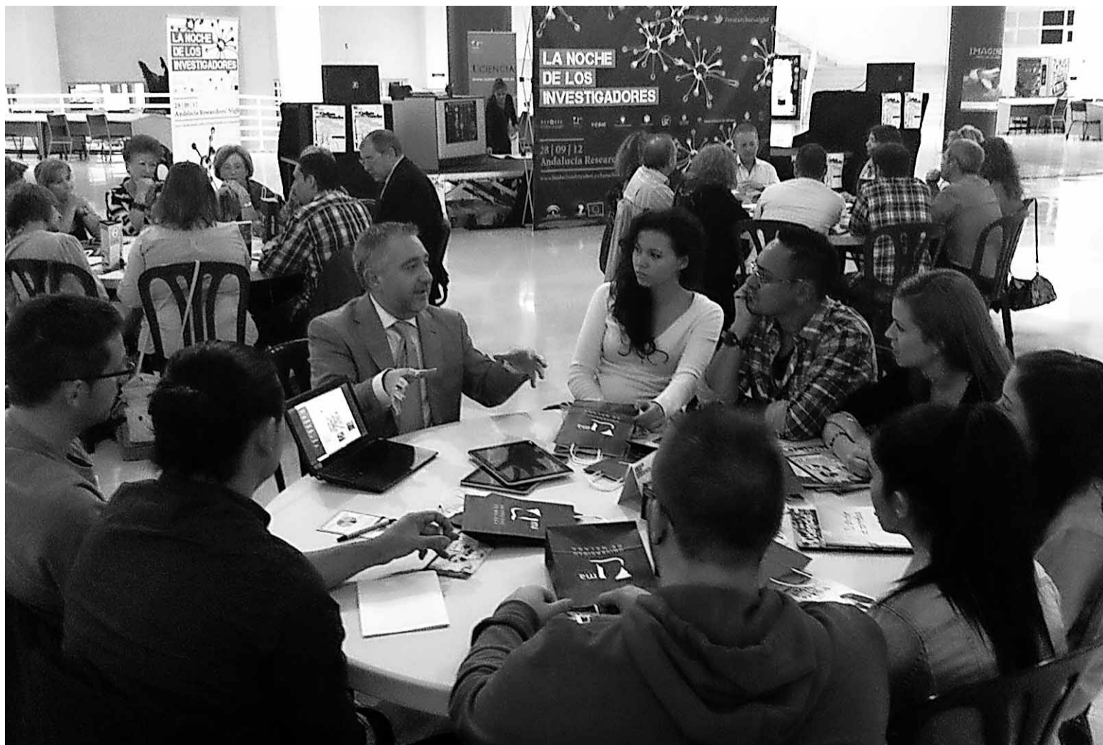
Los asistentes, entre diez y doce por mesa, atendieron la exposición e interactuaron con el investigador.