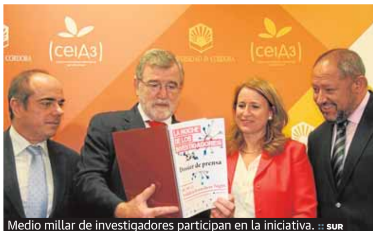
Medio millar de investigadores participan en la iniciativa.

Investigación Researchers' Night. Un total de 500 investigadores compartirán mesa y conversación con más de 5.000 ciudadanos en lo que será el evento simultáneo más importante en el ámbito científico andaluz de los últimos años. Además de Málaga, participarán Córdoba, Sevilla, Jaén, Huelva, Chipiona, Granada y Almería. Paralelamente se celebrará un encuentro virtual al que podrán asistir más de 20.000 usuarios.